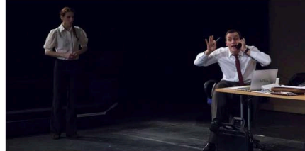
"On a mangé le chameau de M. Hollande"

Par Pierre-Yves Grenu Rédacteur en chef de Culturebox Mis à jour le 23/07/2015 à 00h36, publié le 23/07/2015 à 00h36