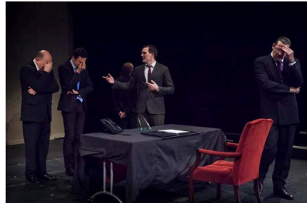
© Sea Urchin Productions / Cie Bewitchez

Nous voici donc plongés dans un cabinet et pas n'importe lequel, celui de la Défense. Le casting : un conseiller de bonne famille particulièrement pleutre (et surtout désopilant : bravo Louis Bernard !); un jeune dircab aux dents longues, pétri d'ambition, le doigt sur le bouton d'ouverture du parapluie; un Général tout ce qu'il y a de rigide; un ministre de tempérament aux colères homériques... et la petite dernière, la charmante chargée de mission venue renforcer l'équipe pour suivre le dossier malien.